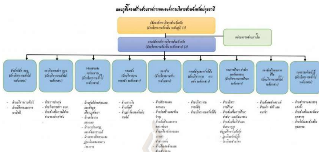
รูปที่ 2.1 แผนภูมิโครงสร้างส่วนราชการองค์การบริหารส่วนจังหวัดปทุมธานี

ทิศทางการจัดการศึกษาขั้นพื้นฐานขององค์การบริหารส่วนจังหวัดปทุมธานี จากการที่พระราชบัญญัติกำหนดแผนและขั้นตอนการกระจายอำนาจให้แก่องค์กรปกครองส่วนท้องถิ่น พ.ศ.2542 มาตรา 17 (16) บัญญัติให้องค์การบริหารส่วนจังหวัดมีอำนาจและหน้าที่ในการจัดการศึกษา ซึ่งอาจดำเนินการด้วยการจัดตั้งสถานศึกษาขึ้นมาใหม่ หรือขอรับการถ่ายโอนสถานศึกษา ในสังกัดกระทรวงศึกษาธิการมาดำเนินการ ทั้งนี้ โดยในปีการศึกษา 2552 องค์การบริหารส่วนจังหวัดปทุมธานี ได้ยื่นขอถ่ายโอนโรงเรียนวัดป่าจิว (ระดับประถมศึกษา) และโรงเรียนสามโคก (ระดับมัธยมศึกษา) ตำบลบ้านจิว อำเภอสามโคก จังหวัดปทุมธานีมาดำเนินการ โดยมีเป้าหมายในการพัฒนาโรงเรียนทั้งสองให้เป็นโรงเรียนแห่งการเรียนรู้ โรงเรียนแห่งความปลอดภัย โรงเรียนมาตรฐานคุณภาพ มีความเป็นเลิศด้านภาษา ดนตรี กีฬา วิชาชีพ ซึ่งกระทรวงศึกษาธิการ โดยสำนักงานคณะกรรมการการศึกษาขั้นพื้นฐาน ได้อนุมัติการถ่ายโอนตามหนังสือสำนักงานคณะกรรมการการศึกษาขั้นพื้นฐาน ที่ ศษ.04003/32 ลงวันที่ 9 เมษายน 2552 ดังนั้น เพื่อให้สถานศึกษาทั้ง 2 แห่ง มีความพร้อมและสามารถจัดการศึกษาให้บรรลุเป้าหมาย อย่างมีประสิทธิภาพ ได้ทันที ในปีการศึกษา 2552 จึงได้จัดทำโครงการนี้ขึ้น (องค์การบริหารส่วนจังหวัดปทุมธานี, 2562ก)