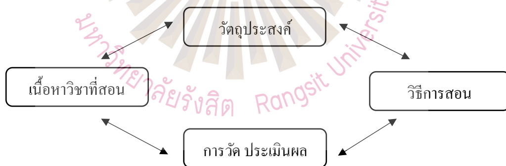
รูปที่ 2.1 แสดงความสัมพันธ์ของโครงสร้างหลักสูตร

ซึ่งทุกพื้นฐานจะต้องมีเกณฑ์ที่เที่ยงตรง เช่น เริ่มจาก วัตถุประสงค์ที่เลือกแล้วว่าสามารถตอบสนองความต้องการส่วนบุคคล สังคมหรือทั้งสองอย่างซึ่งมีผลต่อเนื่องถึงการกำหนดเนื้อหาวิชาโครงสร้างต่าง ๆ นี้ มีอิสระแก่กันต้องเกี่ยวพันกันไปตลอด และอย่างใกล้ชิดไม่ว่าจะตัดสินใจใดไปในทิศทางใดย่อมมีผลกระทบต่อโครงสร้างอื่นด้วย ตัวอย่างเช่น มีการเปลี่ยนแปลงวัตถุประสงค์ก็ต้องมีการเปลี่ยนแปลงเนื้อหาวิธีการสอนและการประเมินผลด้วย เพื่อให้สอดคล้องกับวัตถุประสงค์ ถ้าวัตถุประสงค์มีเพื่อพัฒนาความคิดริเริ่ม วิธีการสอนก็ต้องเปลี่ยนไปไม่ใช่การสอนให้จำแบบเดิมซึ่งจะต้องเป็นการสอนแบบการแก้ปัญหา และถ้าจะสอนให้มีทักษะก็ต้องใช้วิธีสอนที่จะพัฒนาทักษะได้ และการประเมินผลก็ต้องประเมินการกระทำด้วย (Taba, 1962)