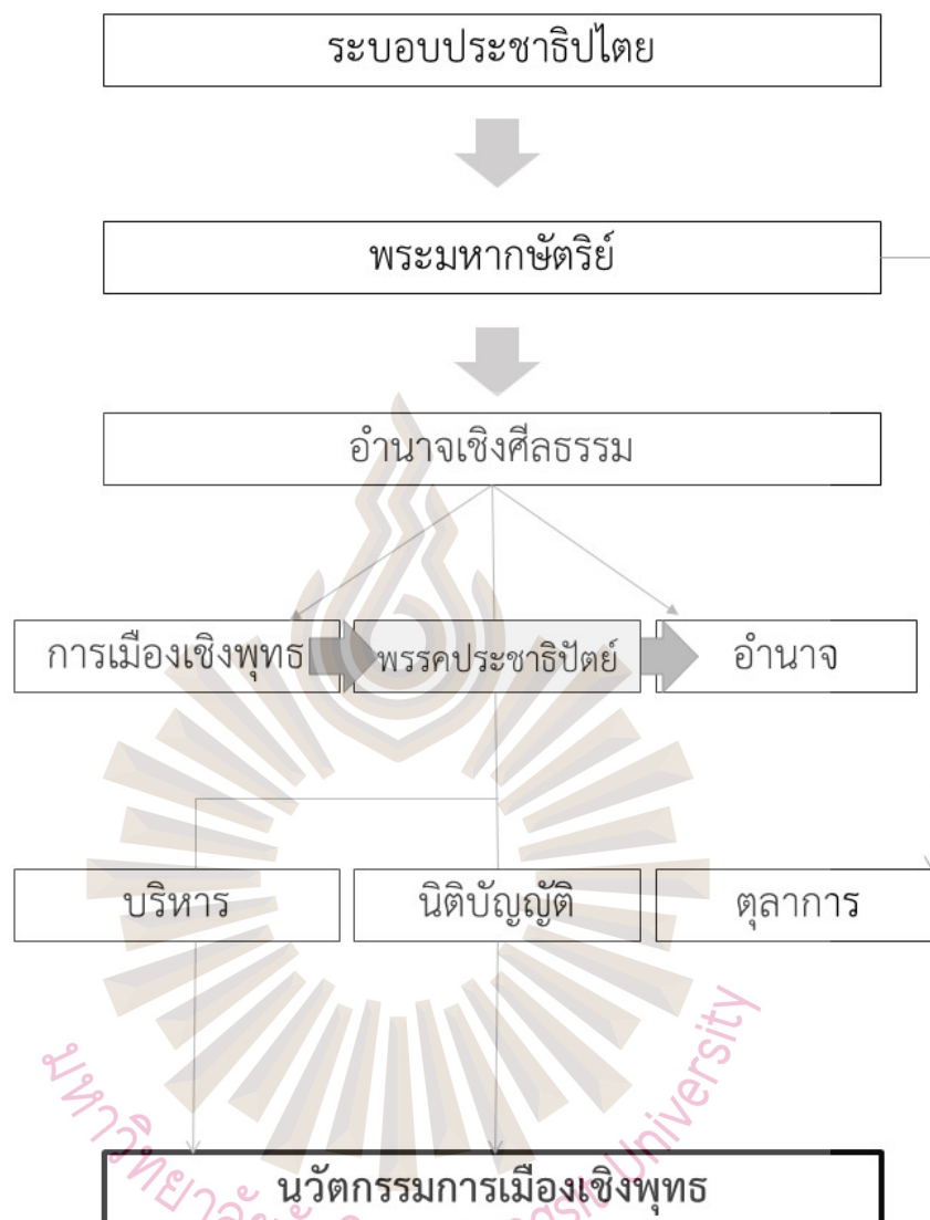
รูปที่ 2.2 กรอบแนวคิดการวิจัย