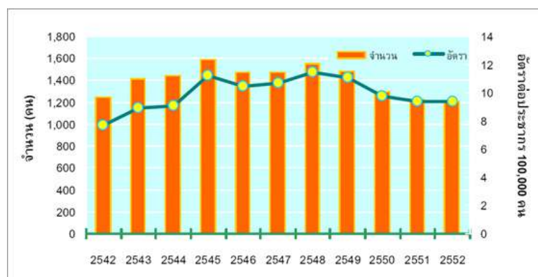
รูปที่ 1.2 แผนภาพแสดงจำนวนและการเสียชีวิต ต่อประชากร 100,000 คน ของเด็กอายุต่ำกว่า 15 ปี เนื่องจากการตกน้ำหรือจมน้ำของประเทศไทย ปี 2542 - 2552 22

และกลุ่มอายุที่เสียชีวิตจากการจมน้ำมากที่สุด จากการวิเคราะห์ข้อมูลการเสียชีวิตจากการตกน้ำหรือจมน้ำในเด็กอายุต่ำกว่า 15 ปี ของสำนักโรคไม่ติดต่อ กรมควบคุมโรค พบว่า กลุ่มเด็กที่เสียชีวิตจากการจมน้ำสูงสุด ได้แก่ เด็กที่มีอายุ 5-9 ปี รองลงมา คือ 0-4 ปี และ 10-14 ปี