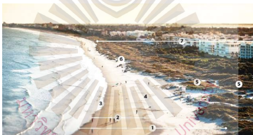
รูปที่ 2.1 ภาพแสดงตำแหน่งต่างๆ บริเวณริมทะเล 45