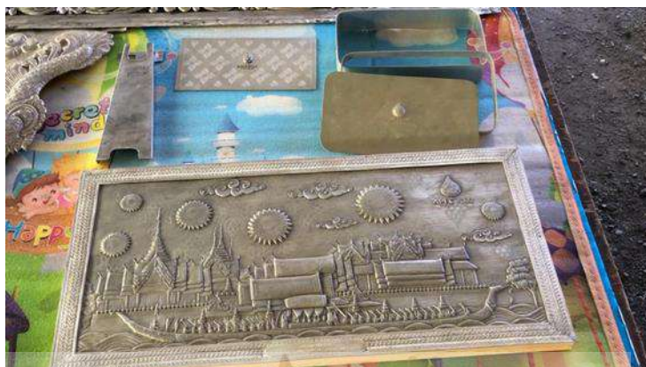
รูปที่ 5.1 ภาพคุณโลหะรัชตะแสนตอก ของที่ระลึกงานเอเปค 2022

สำหรับเครื่องถมชุมชนเมือง จังหวัดนครศรีธรรมราชภาคเอกชน ซึ่งได้รับผลประโยชน์มาจากแรงจูงใจจากผลกำไร โอกาสในการขยายธุรกิจ และเพิ่มช่องทางการลงทุนยิ่งขึ้น ในการร่วมมือของเอกชนส่วนใหญ่ร่วมกับภาครัฐ อาทิ สำนักงานการท่องเที่ยวและกีฬาจังหวัดนครศรีธรรมราช ภาครัฐ เอกชน เมืองนครศรีธรรมราช ร่วมกันฟื้นฟูเครื่องถม โดยพาไปเยี่ยมชมศูนย์เรียนรู้หัตถศิลป์ไทย ให้เห็นการสาธิตการแกะสลักเครื่องถมด้วยสิ่งเล็ก ๆ เพื่อแกะสลักลวดลายที่มีความละเอียด ประณีต อาทิ ช่อง Nokhonsistation.com จัดรายการคนต้นแบบเมืองนคร โดยมองเกียรติบัตรแสดงความขอบคุณผู้ที่เข้ามาร่วมรายการเกี่ยวกับการสืบสานงานศิลป์ อนุรักษ์เครื่องถม สำนักงานส่งเสริมการค้าสินค้าไทย ไลฟ์สไตล์ กรมการค้าระหว่างประเทศ จัดนิทรรศการเครื่องถมและเครื่องประดับเงิน ภายในงานแสดงสินค้าอัญมณี และเครื่องประดับ ครั้งที่ 65 จัดขึ้นระหว่างวันที่ 25-29 กุมภาพันธ์ 2563 ณ อาคารชาเลนเจอร์ 2 ศูนย์แสดงสินค้าและการประชุม อิมแพ็คเมืองทองธานี และที่บริเวณวัดพระธาตุมุทิวาวิหาร ท่าช้าง อำเภอเมือง จังหวัดเชียงใหม่ เป็นแหล่งขายผลิตภัณฑ์ OTOP เครื่องถม อาทิ กำไล พาน ชัน สร้อย และอื่น ๆ