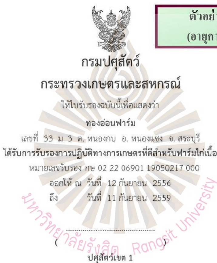
รูปที่ 4.1 ตัวอย่างใบรับรอง กรณีรับรองฟาร์มใหม่ (ฉบับภาษาไทย)

และจัดทำใบรับรองการปฏิบัติทางการเกษตรที่ดีด้านปศุสัตว์ จากนั้นเจ้าหน้าที่สำนักงานปศุสัตว์ เขต ส่งใบรับรองให้สำนักงานปศุสัตว์จังหวัด และให้สำนักงานปศุสัตว์จังหวัดดำเนินการส่ง ใบรับรองให้แก่ผู้ประกอบการเป็นลำดับต่อไป ซึ่งใบรับรองการปฏิบัติทางการเกษตรที่ดีสำหรับ ฟาร์ม ไก่เนื้อที่มีอายุการรับรอง 3 ปี โดยตัวอย่างใบรับรองการปฏิบัติทางการเกษตรที่ดีด้านปศุสัตว์ ในกรณีเป็นการรับรองฟาร์มใหม่ที่มีอายุการรับรอง 3 ปี แสดงดังภาพที่ 4.1