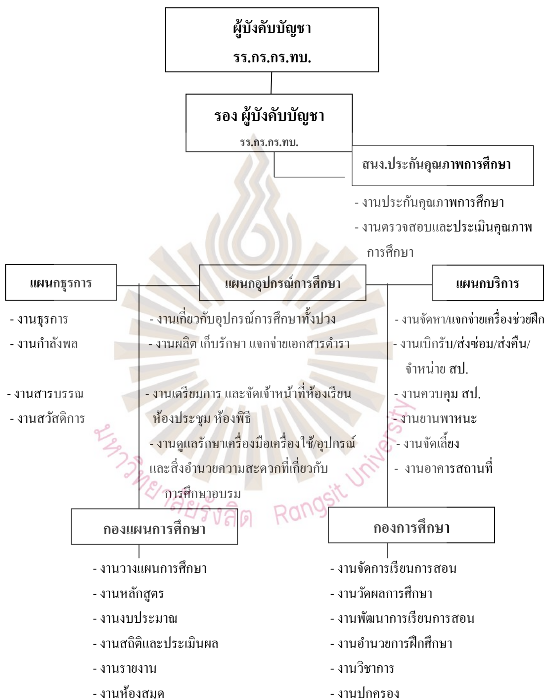
รูปที่ 2.3 แผนภูมิการปฏิบัติงาน (Activity Chart)

โรงเรียนกิจการพลเรือน กรมกิจการพลเรือนทหารบก