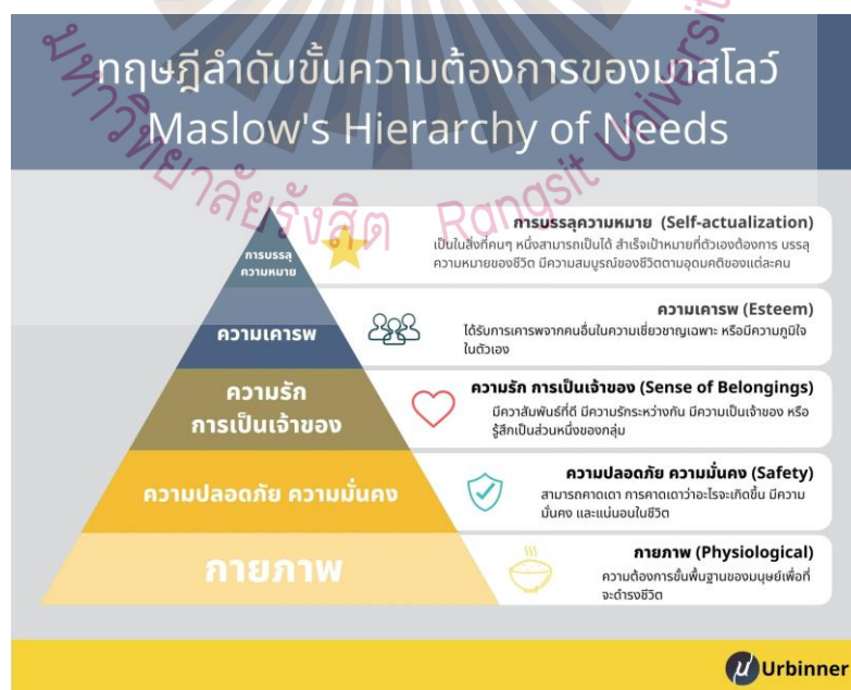
ภาพที่ 2.2 ทฤษฎีลำดับขั้นความต้องการของมาสโลว์ (Maslow's Hierarchy of Needs) ที่มา: วชิรวัชร งามละม่อม (2558)

โดยทฤษฎีนี้เป็นที่รู้จักอย่างแพร่หลาย ซึ่งเกิดจากนักจิตวิทยาชื่อ อับราฮัม มาสโลว์ (Abraham Maslow) ตั้งแต่ปี ค.ศ. 1943 ในงานเขียนชื่อ A Theory of Human Motivation และในหนังสือชื่อ Motivation and Personality