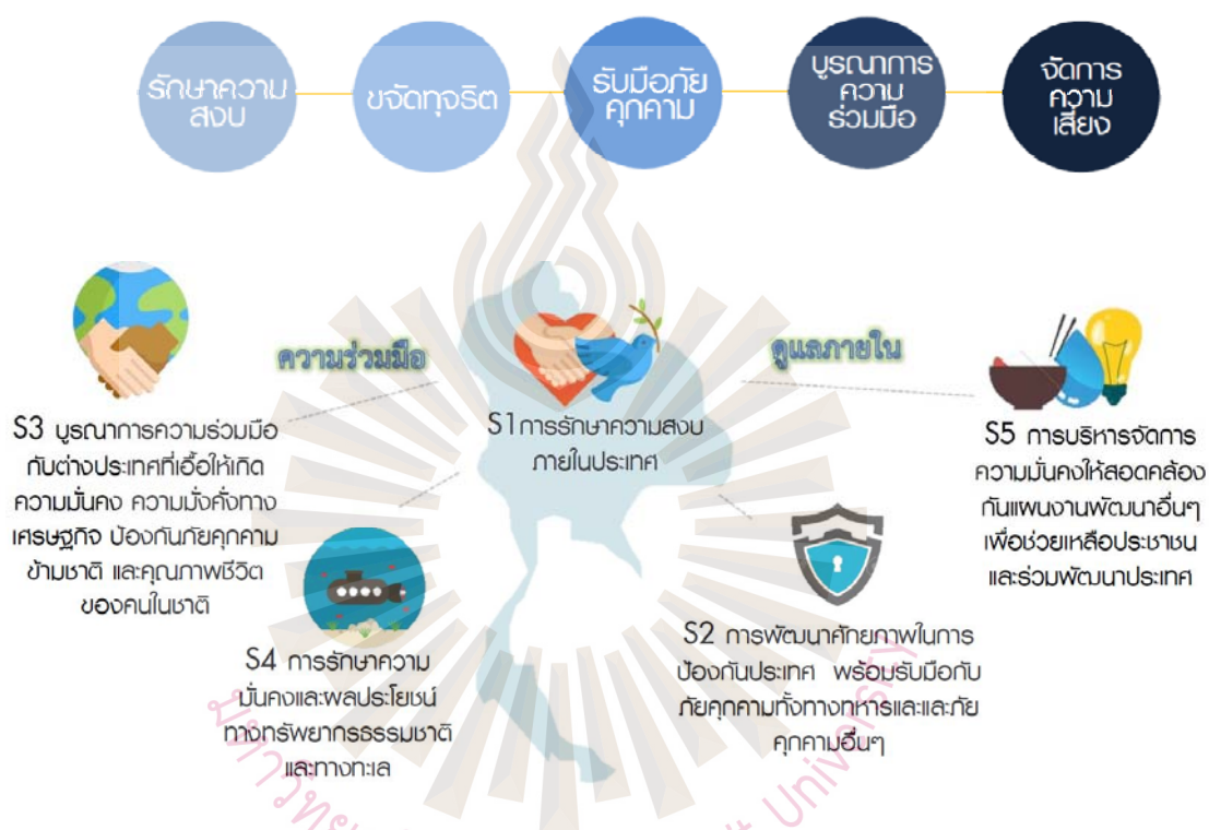
รูปที่ 2.2 เป้าหมายของยุทธศาสตร์ชาติด้านความมั่นคง

ที่มา: สำนักงานเลขาธิการสภาผู้แทนราษฎร, 2560