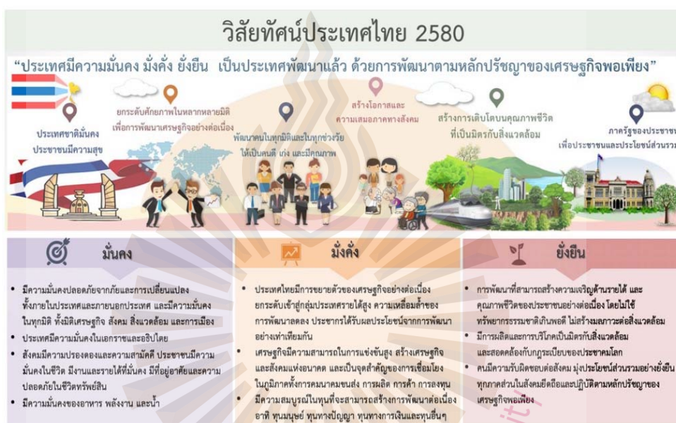
รูปที่ 2.1 วิสัยทัศน์ของยุทธศาสตร์ชาติระยะ 20 ปี