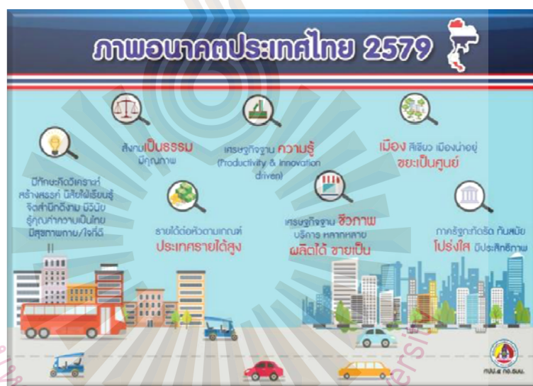
รูปที่ 2.3 ภาพอนาคตประเทศไทย ปี 2579

เกี่ยวในพื้นที่เอกชน การปรับปรุงกลไกรัฐเพื่อการปรับเปลี่ยนพฤติกรรม ที่เป็นมิตรต่อสิ่งแวดล้อม ของประชาชนและภาคเอกชนสร้างการเติบโตอย่างยั่งยืนบนสังคมเศรษฐกิจภาคทะเล มุ่งเน้นการให้ความสำคัญ กับการสร้างการเติบโตของประเทศจากกิจกรรมทางทะเลที่หลากหลายควบคู่ไปกับการดูแล ฐานทรัพยากรทางทะเลและชายฝั่งทั้งหมด ภายใต้อำนาจและสิทธิประโยชน์ของประเทศที่พึงมี พึ่งได้ เพื่อความเป็นธรรมและลดความเหลื่อมล้ำทางสังคม โดยมุ่งเน้นการถ่ายทอดองค์ความรู้เรื่อง ทะเลที่ถูกดองและเพียงพอเพิ่มมูลค่าของเศรษฐกิจฐานชีวภาพทางทะเล ปรับปรุงและฟื้นฟู ทรัพยากร ทางทะเลและชายฝั่งทั้งระบบ พัฒนาและเพิ่มสัดส่วนกิจกรรมทางทะเลที่เป็นมิตรต่อ สิ่งแวดล้อม