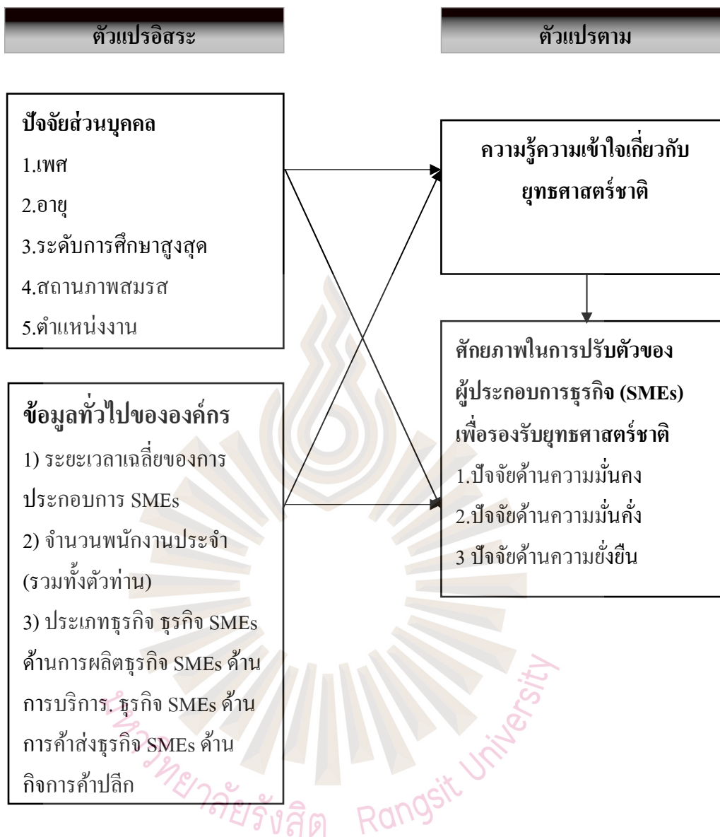
รูปที่ 1.1 กรอบแนวคิดการวิจัย