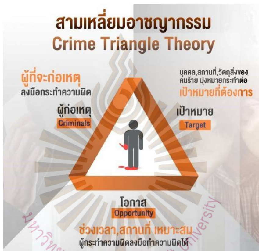
รูปที่ 2.1 สามเหลี่ยมอาชญากรรม

ดังนั้นประชาชนก็สามารถนำทฤษฎีสามเหลี่ยมอาชญากรรมนี้มาป้องกันตนเองได้ โดยง่าย ลดความเสี่ยงในการเกิดอาชญากรรมได้ด้วยตัวคุณเอง คือ ไม่ทำให้ตัวเองเป็นเหยื่อหรือ เป้าหมาย ไม่นำพาตนเองไปสู่โอกาสหรือสถานการณ์เสี่ยง ซึ่งเป็นการตัดองค์ประกอบด้านใด ด้านหนึ่งไป ก็สามารถป้องกันการเกิดอาชญากรรมได้