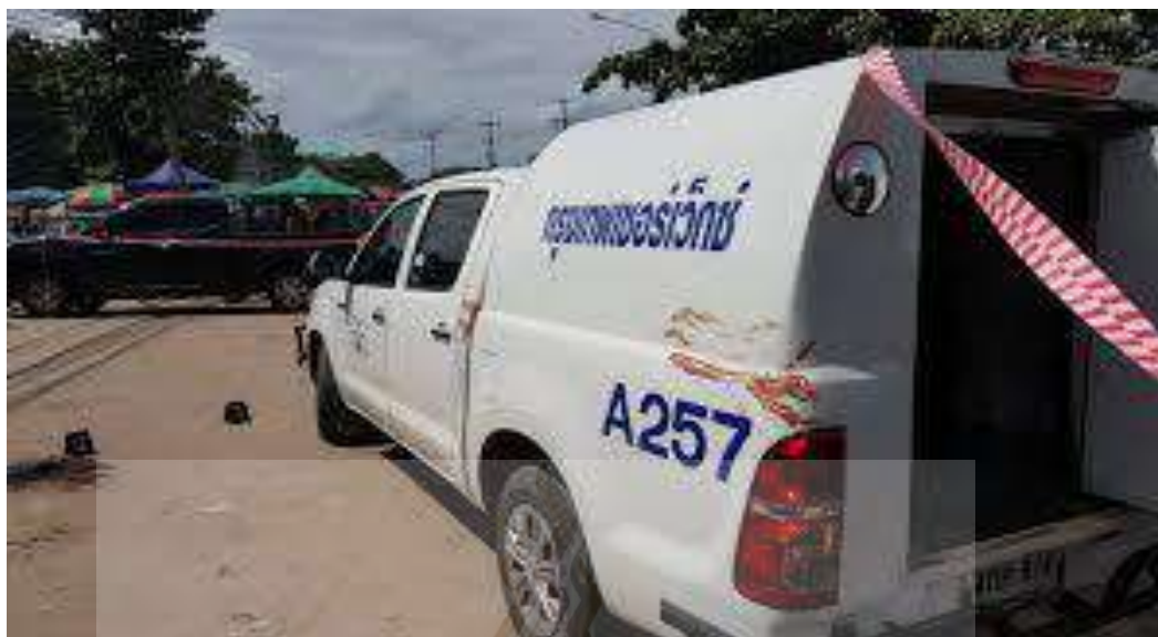
รูปที่ 2.4 รถขนเงินบริษัท กรุงเทพเซอร์เว็กซ์ จำกัด (1)