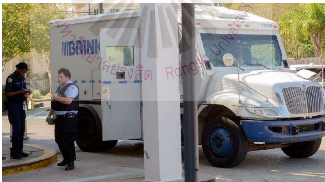
รูปที่ 2.9 รถขนเงินต่างประเทศ (Brinks)