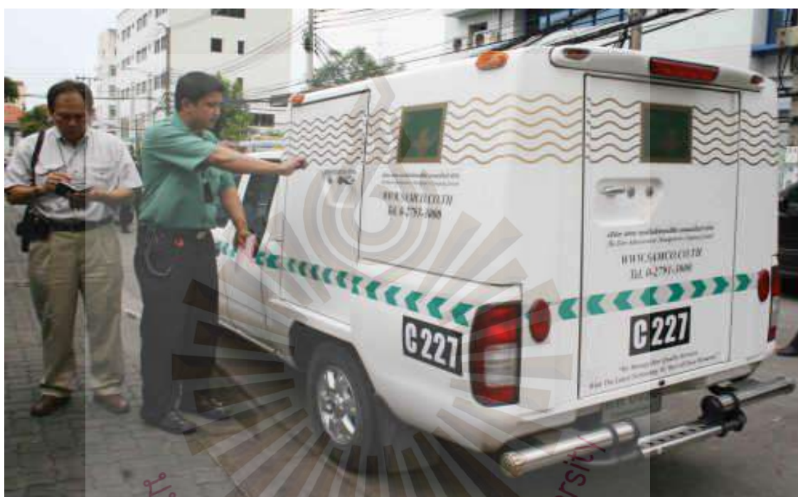
รูปที่ 2.3 รถขนเงินบริษัท สยาม แอ๊ดมินนิสเตอร์ทีฟ แมเนจเม้นท์ จำกัด (SAMCO)

ลักษณะทางกายภาพภายนอกของรถขนเงินในประเทศไทยส่วนใหญ่ใช้รถยนต์กระบะ 4 ประตูที่มีการปรับเปลี่ยนมิหลังคา หรือรถตู้ และดัดแปลงภายในให้สามารถเก็บทรัพย์สินมีค่าที่ต้องการขนส่งไว้ภายใน โดยพื้นที่ในรถมีความจุมากกว่ารถยนต์ 4 ประตูโดยสารทั่วไป เนื่องจากรถยนต์ประเภทดังกล่าวสามารถจัดหาเพื่อใช้งานได้ง่ายในประเทศไทย โดยมีการเสริมอุปกรณ์ต่างๆ เช่น เสริมเหล็ก กระจกกันกระสุน ติดตั้งสัญญาณติดตาม เพิ่มเติมได้ โดยไม่ต้องนำเข้ารถหุ้มเกราะซึ่งมีมูลค่าสูง อีกทั้งบริษัทรักษาความปลอดภัยรถขนเงินมีการทำประกันทรัพย์สินไว้