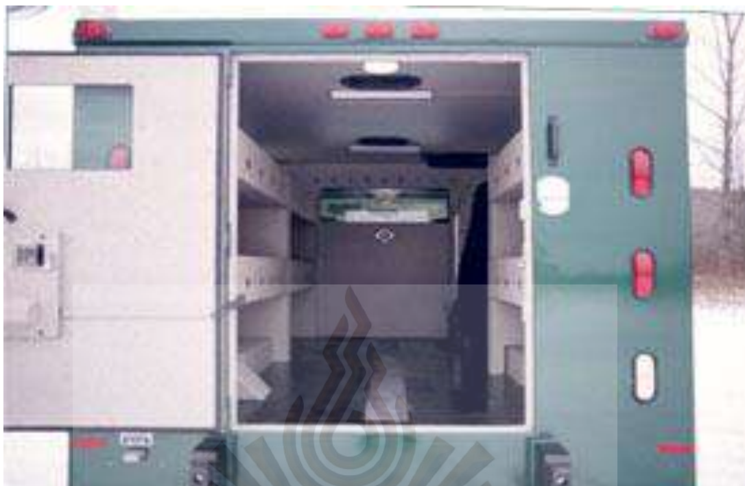
รูปที่ 2.10 ลักษณะภายในรถขนเงินของต่างประเทศ

จากรูปภาพรถขนเงินของประเทศไทยจะพบว่าภายในมีการทำห้องนิรภัยในการรักษาทรัพย์สิน โดยมีลักษณะเป็นรถเกราะกันกระสุน โดยจะสามารถเปิดได้จากด้านนอกโดยใช้กุญแจที่อยู่กับเจ้าหน้าที่รักษาความปลอดภัย และสามารถเปิดจากภายในได้เช่นกัน โดยรถขนเงินในประเทศไทยนั้นจะมีระบบกล้องและระบบติดตั้งระบบค้นหาตำแหน่ง (การติดตั้งระบบ GPS) เช่นเดียวกับรถขนเงินในต่างประเทศ ซึ่งมีมาตรฐานเดียวกัน แต่ความแตกต่างของสภาพลักษณะทางกายภาพรถขนเงินคือเป็นรถปิกอัพ 4 ประตู หรือ รถตู้ที่นำมาดัดแปลงให้เป็นรถขนเงิน ซึ่งเมื่อหากเปรียบเทียบกับรถขนเงินในต่างประเทศ จะเป็นรถหุ้มเกราะโดยเฉพาะ โดยมีขนาดใหญ่และแข็งแรงมากกว่า