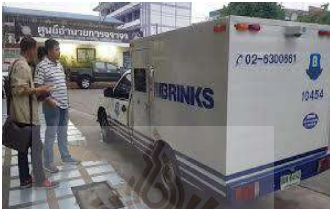
รูปที่ 2.6 รถขนเงินบริษัท บริงค์ส (ประเทศไทย) จำกัด (Brinks) ที่มา: พีพีทีวี, 2560