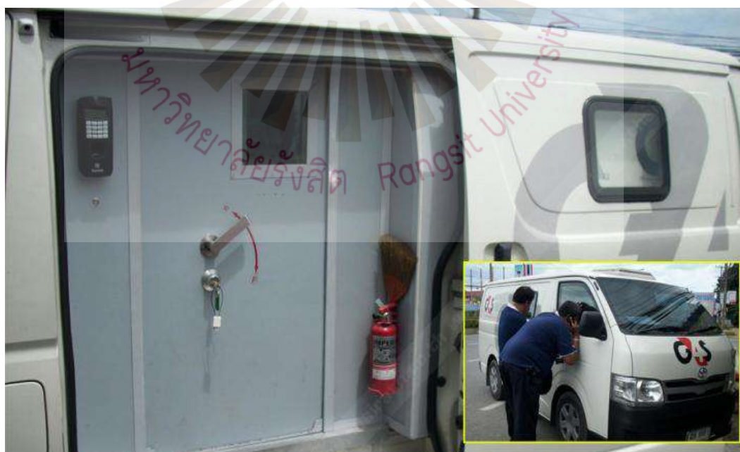
รูปที่ 2.7 รถขนเงินบริษัท รักษาความปลอดภัย จี4เอส เซอร์วิสเชส (ประเทศไทย) จำกัด ที่มา: ไทยรัฐออนไลน์, 2557