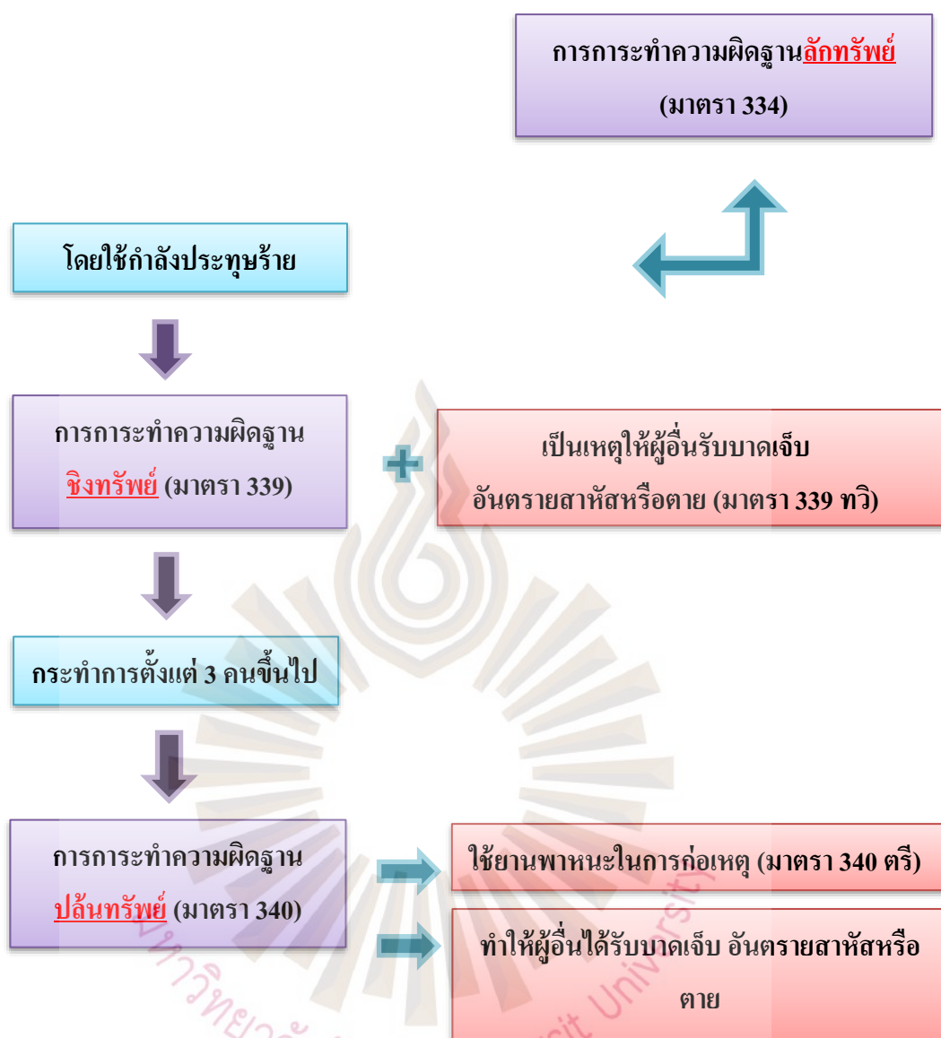
รูปที่ 2.2 แผนผังอธิบายข้อกำหนดโทษ ลักษณะในการกระทำความผิดฐานลักทรัพย์ ชิงทรัพย์ และปล้นทรัพย์