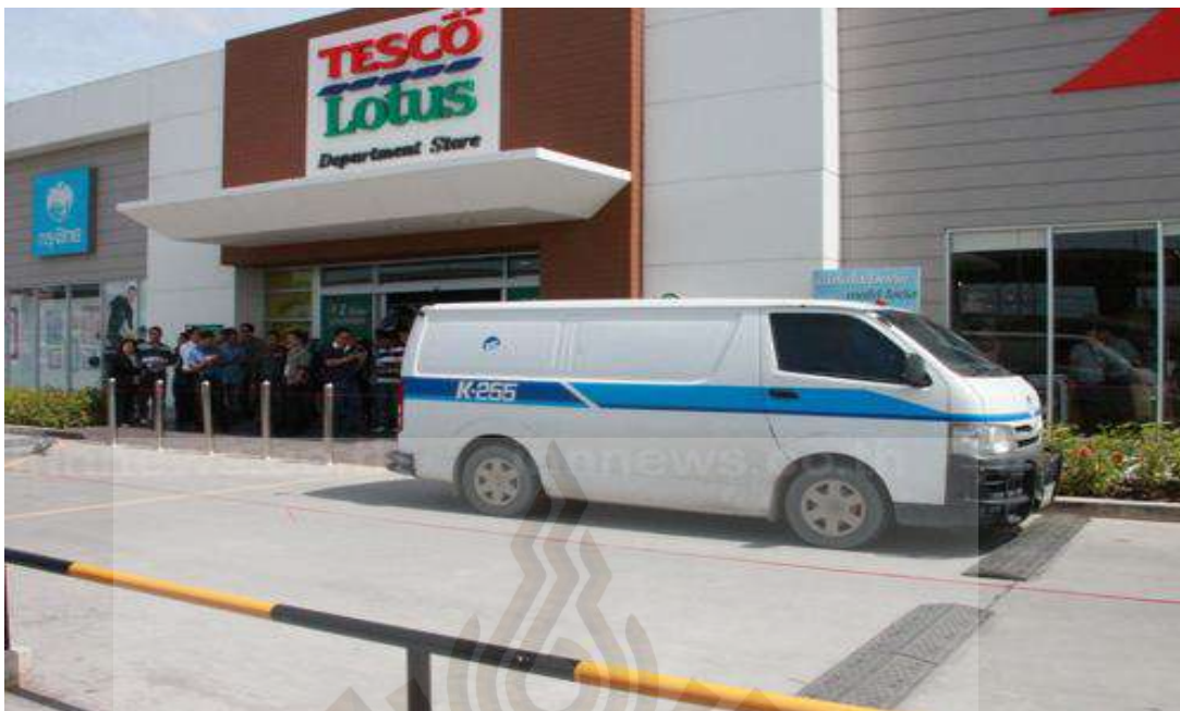
รูปที่ 2.8 บริษัท รักษาความปลอดภัย กรุงไทยธุรกิจบริการ จำกัด