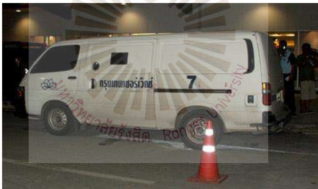
รูปที่ 2.5 รถขนเงินบริษัท กรุงเทพเซอร์เว็กซ์ จำกัด (2)