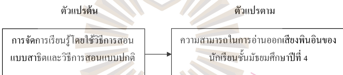
รูปที่ 1.1 กรอบแนวคิดการวิจัย

การจัดการเรียนรู้โดยใช้วิธีการสอนแบบสาธิตมีผลทำให้นักเรียนมีความสามารถในการอ่านออกเสียงพินอินที่มี j q x zh ch sh z c s ประสมอยู่ ได้ตามวัตถุประสงค์ของการวิจัยเรื่องนี้ ซึ่งเขียนเป็นกรอบแนวคิดการวิจัย ได้ดังนี้