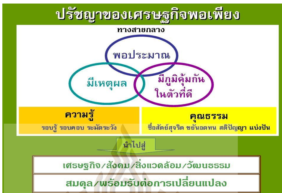
รูปที่ 2.2 องค์ประกอบของเศรษฐกิจพอเพียง