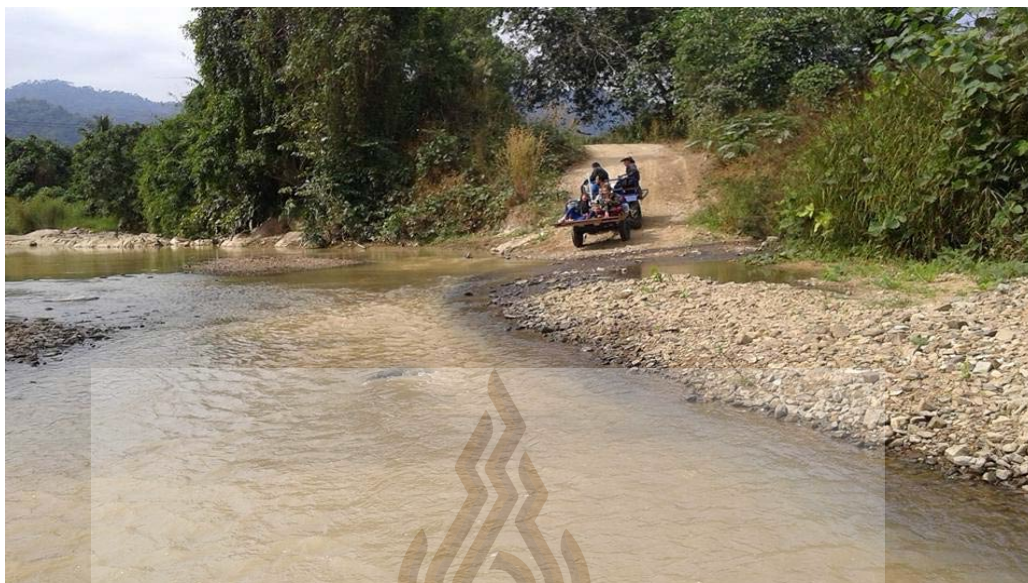
รูปที่ 4.7 กิจกรรมนั่งรถอีแต๋นล่องแก่ง