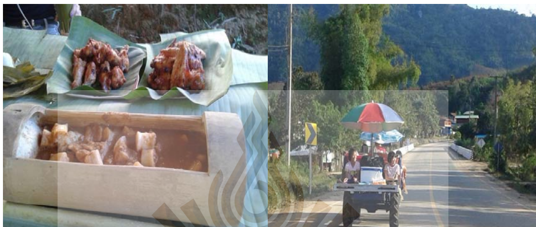
รูปที่ 4.5 นักรถไอ้เด็กเที่ยว และรับประทานอาหารพื้นบ้านกลางป่า ที่มา : พรทิพา บุญศิริ, 2561

เช่น สวนเงาะ ลำไยเก็บกินได้ กิจกรรมซื้อของฝาก กล้ายแปรรูป ไม้กวาด ช่วงค่ำมีกิจกรรม โสมพา แลง การต้อนรับแบบภาคอีสาน นายศรีผู้ขวัญ