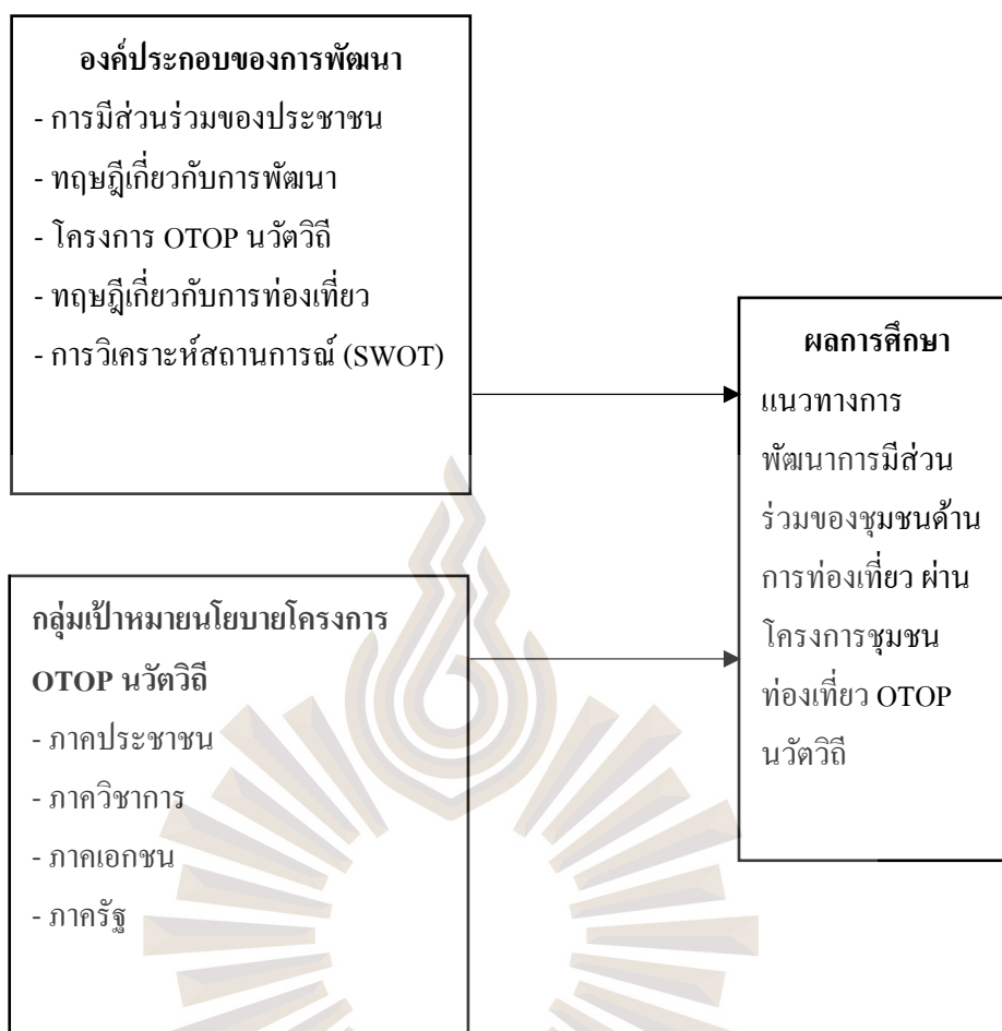
รูปที่ 2.1 กรอบแนวคิดการวิจัย