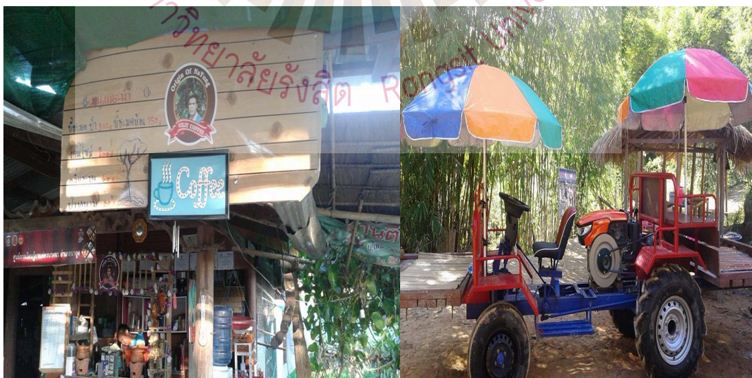
รูปที่ 4.3 สิ่งอำนวยความสะดวก

สิ่งอำนวยความสะดวก ในชุมชนคีรีวงศ์ มีร้านค้าประจำชุมชนอยู่ประมาณ 5 แห่ง จำหน่ายสินค้าทั่วไป มีร้านอาหารในที่พักสามารถสั่งอาหารรับประทานได้ มีสัญญาณโทรศัพท์ให้ติดต่อสื่อสารได้ แต่บางจุดสัญญาณอาจจะขาดหายไป