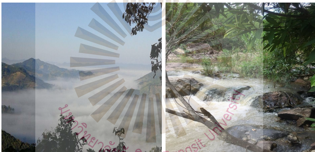
รูปที่ 4.4 ด้านสิ่งดึงดูดใจ

สิ่งดึงดูดใจในชุมชน คือ เรื่องของลักษณะทางธรรมชาติ และวิถีชีวิตโดยชุมชนนำลักษณะวิถีชีวิต คือ เรื่องการเกษตรมาเป็นจุดขาย โดยชุมชนมีพาหนะ คือ รถอีแต๋นที่ใช้ขนส่งผลิตภัณฑ์ทางการเกษตรนำมาเป็นจุดขายดึงดูดนักท่องเที่ยว ประกอบกับชุมชนมีวิวทิวทัศน์ที่ล้อมรอบไปด้วยหุบเขาจึงได้ชื่อว่า หมู่บ้านคีรีวงกต นอกจากนั้นแล้วยังมีลำห้วยชื่อ ห้วยน้ำฮวย ที่น้ำไหลตลอดทั้งปี มีน้ำตกห้วยช้างพลายที่มีน้ำไหลตลอดทั้งปีไว้คอยดึงดูดนักท่องเที่ยวให้เข้าไปท่องเที่ยว ในช่วงเช้าจะมีจุดชมวิวยอดภูพระอาทิตย์ขึ้นสามารถมองเห็นวิวทิวทัศน์ของหมู่บ้านคีรีวงกต ทั้งหมด 4 และหมู่ 8 ได้สวยงามนอกจากนั้นแล้วชุมชนยังมี สวนผลไม้ เช่น เงาะ ลำไย กล้วย เป็นต้น ไว้คอยให้นักท่องเที่ยวได้เข้าไปเที่ยวชม