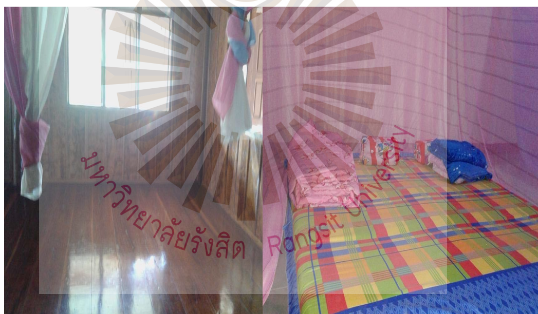
รูปที่ 4.1 ที่พักบ้านคีรีวงกต อำเภอนาโยง จังหวัดอุตรธานี

1) ด้านที่พัก บ้านคีรีวงกต มีที่พักแบบโฮมสเตย์ไว้คอยบริการนักท่องเที่ยวประมาณ 20 ห้อง และมีจุดกางเต็นท์ 3 แห่ง คือ กลุ่มท่องเที่ยวหมู่ 8 กลุ่มท่องเที่ยวหมู่ 4 และ ภูคีรีโฮมสเตย์