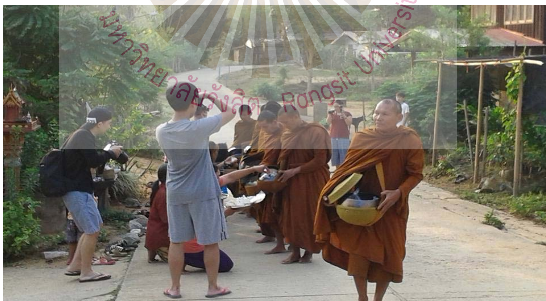
รูปที่ 4.6 กิจกรรมช่วงเช้าทำบุญตักบาตร