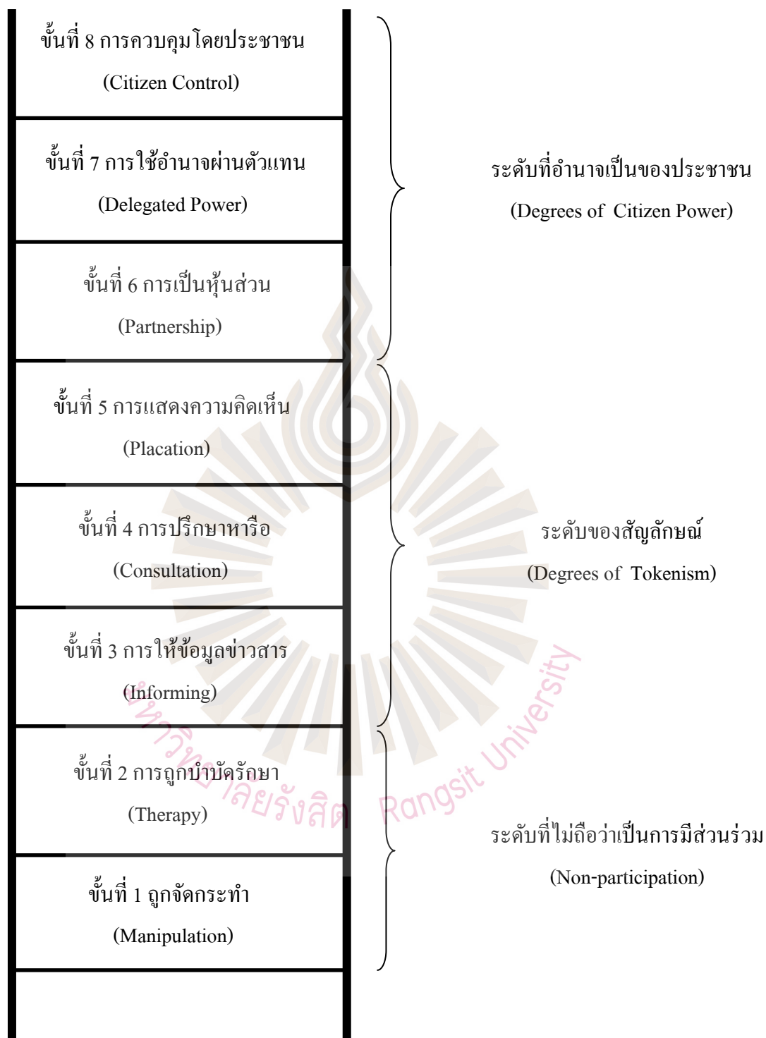
รูปที่ 2.1 ขั้นบันไดการมีส่วนร่วมของประชาชน