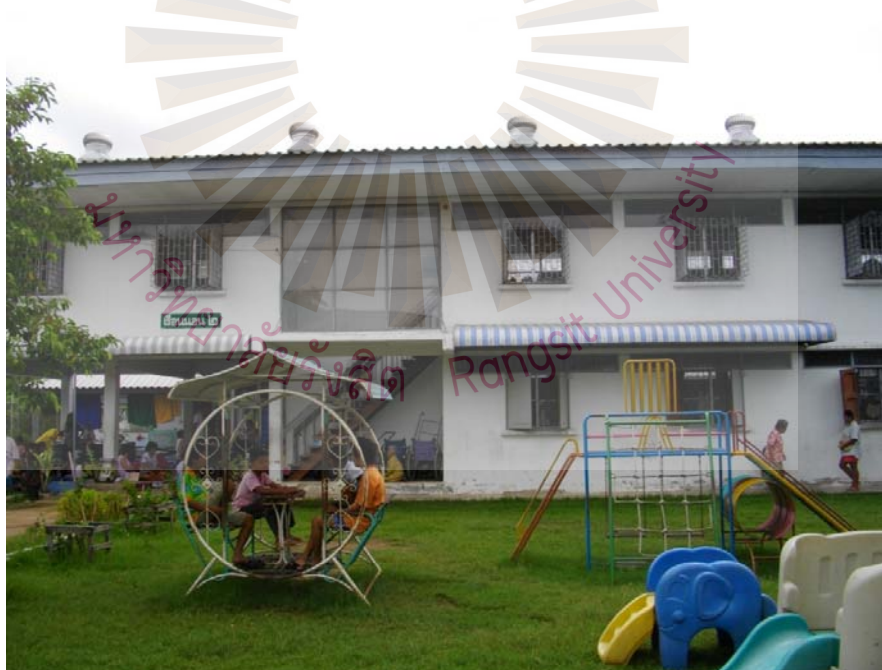
รูปที่ ภาคผนวก ง.8 ภาพอาคารพักหลังที่ 2 24 พฤษภาคม 2561