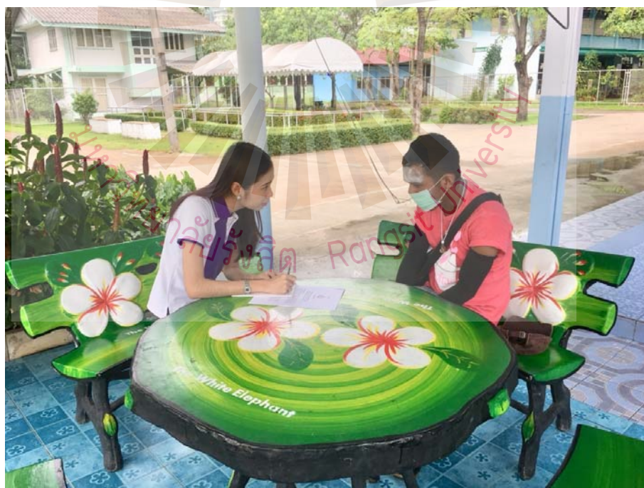
รูปที่ ภาคผนวก ง.4 ภาพขณะสัมภาษณ์ผู้ให้ข้อมูลสำคัญ ที่มา ผู้วิจัย 23 พฤษภาคม 2561