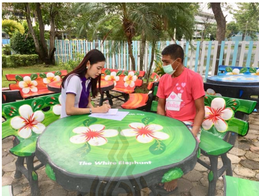
รูปที่ ภาคผนวก ง.1 ภาพขณะสัมภาษณ์ผู้ให้ข้อมูลสำคัญ ที่มา ผู้วิจัย 23 พฤษภาคม 2561