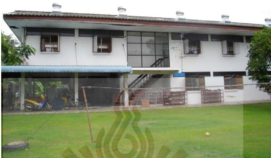
รูปที่ ภาคผนวก ง.7 ภาพอาคารพักหลังที่ 1 ที่มา ผู้วิจัย 24 พฤษภาคม 2561