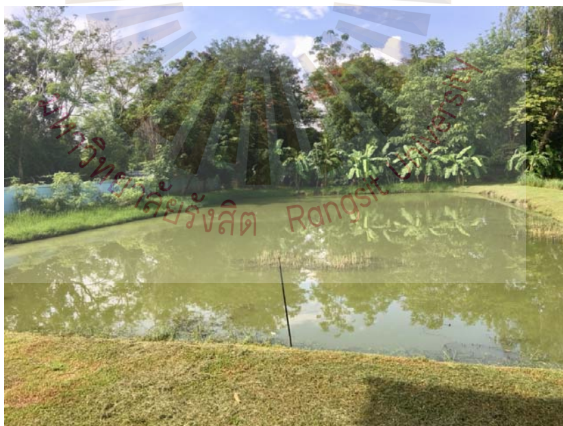
รูปที่ ภาคผนวก ง.14 พื้นที่บ่อเลี้ยงปลา ตามโครงการชัยบุรีโมเดล ที่มา ผู้วิจัย 24 พฤษภาคม 2561