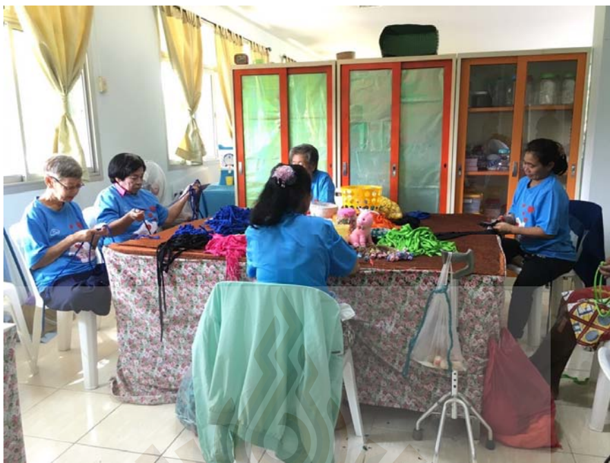
รูปที่ ภาคผนวก ง.15 กิจกรรมงานฝีมือ ตามโครงการชัยบุรีโมเดล 25 พฤษภาคม 2561