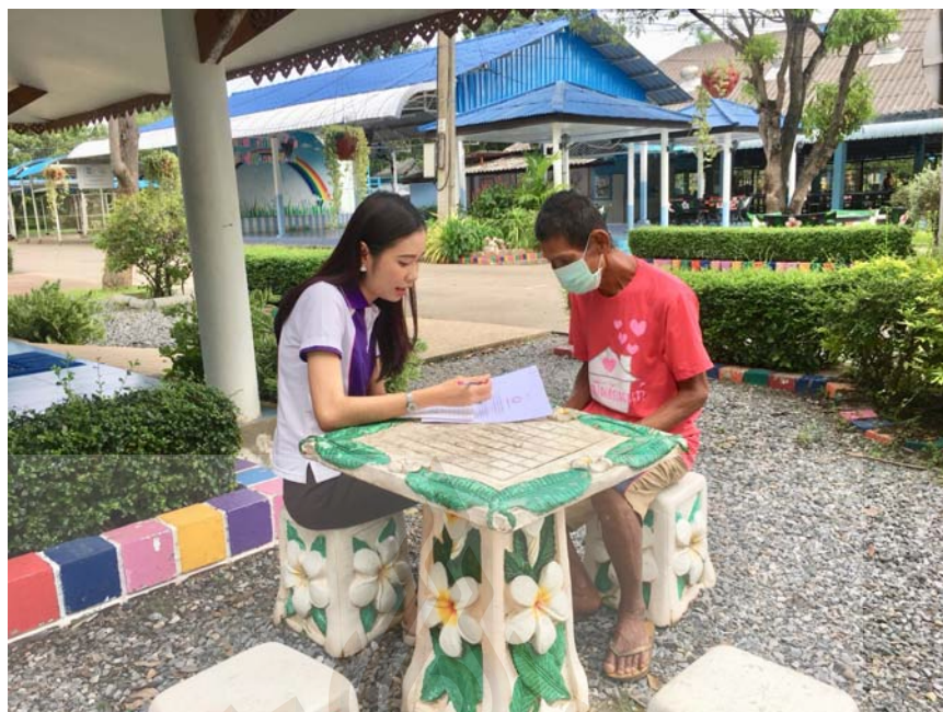
รูปที่ ภาคผนวก ง.5 ภาพขณะสัมภาษณ์ผู้ให้ข้อมูลสำคัญ 23 พฤษภาคม 2561