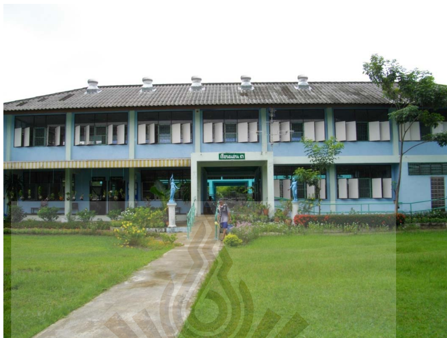
รูปที่ ภาคผนวก ง.9 ภาพอาคารพักหลังที่ 3 24 พฤษภาคม 2561