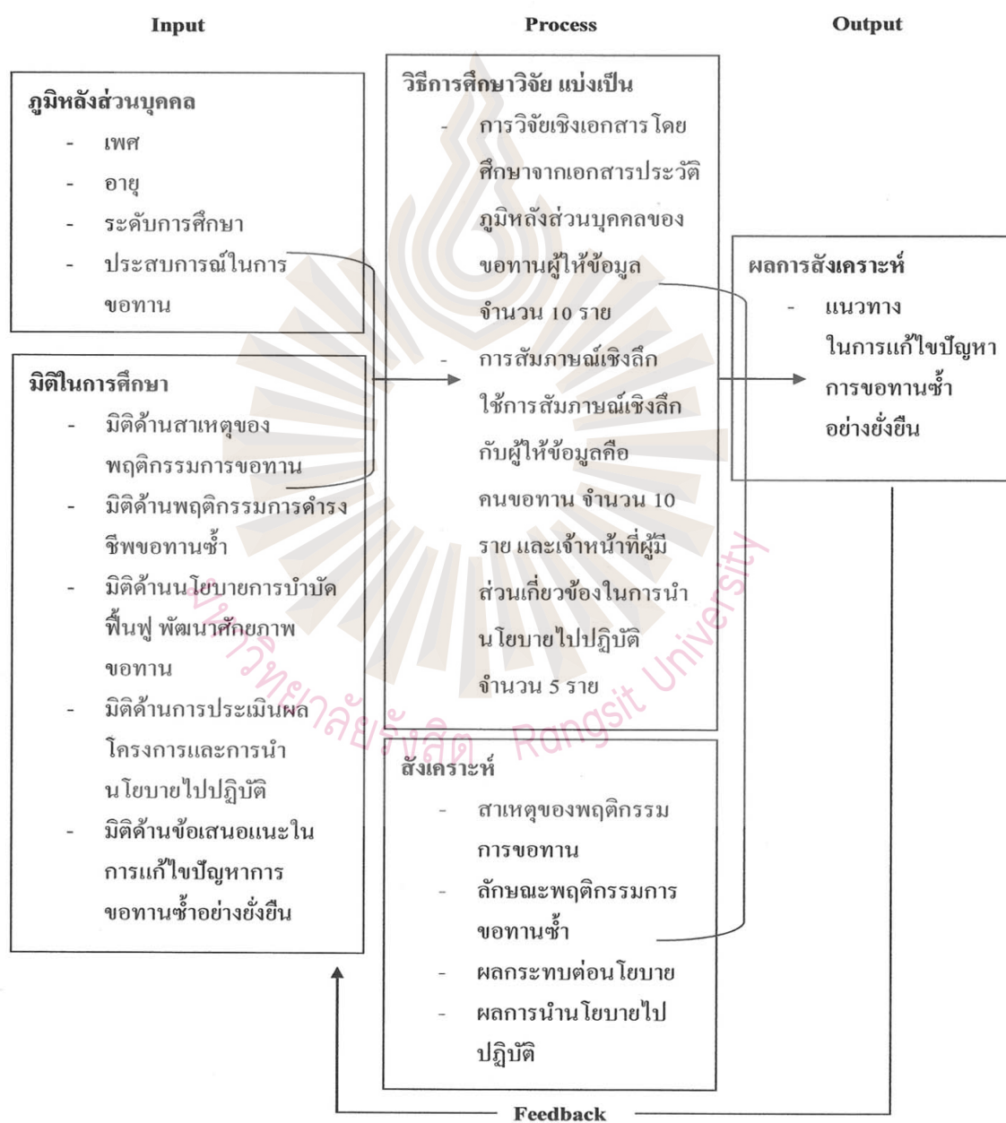
รูปที่ 2.1 กรอบแนวคิดในการวิจัย

การกำหนดกรอบแนวคิดในการวิจัยนั้น ผู้วิจัยศึกษาจากแนวคิด ทฤษฎี และผลงานวิจัยที่เกี่ยวข้อง เพื่อต้องการที่จะศึกษาถึง ปัจจัยของการกลับเข้าสู่การเป็นคนขอทานซ้ำของผู้รับการสงเคราะห์ ในสถานคุ้มครองคนไร้ที่พึ่งนนทบุรี ซึ่งผู้วิจัยได้กำหนดกรอบแนวความคิด ดังนี้