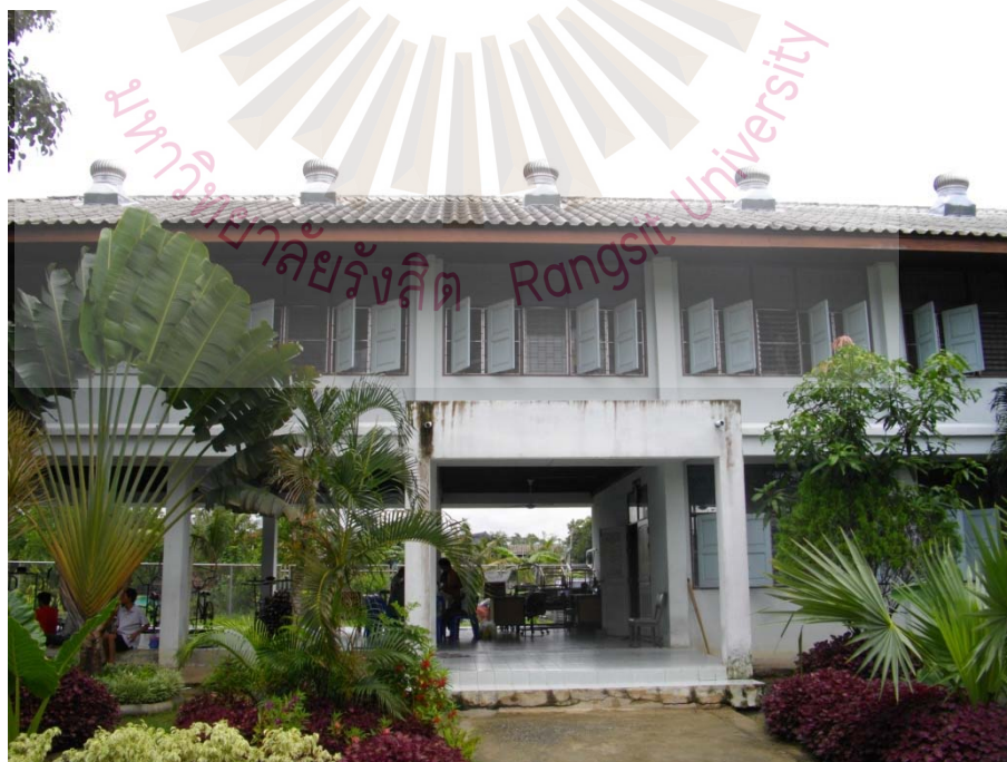
รูปที่ ภาคผนวก ง.10 ภาพอาคารพักหลังที่ 4 24 พฤษภาคม 2561