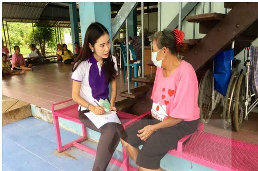
รูปที่ ภาคผนวก ง.3 ภาพขณะสัมภาษณ์ผู้ให้ข้อมูลสำคัญ 23 พฤษภาคม 2561