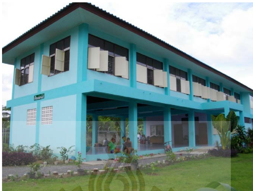
รูปที่ ภาคผนวก ง.11 ภาพอาคารพักหลังที่ 5 ที่มา ผู้วิจัย 24 พฤษภาคม 2561