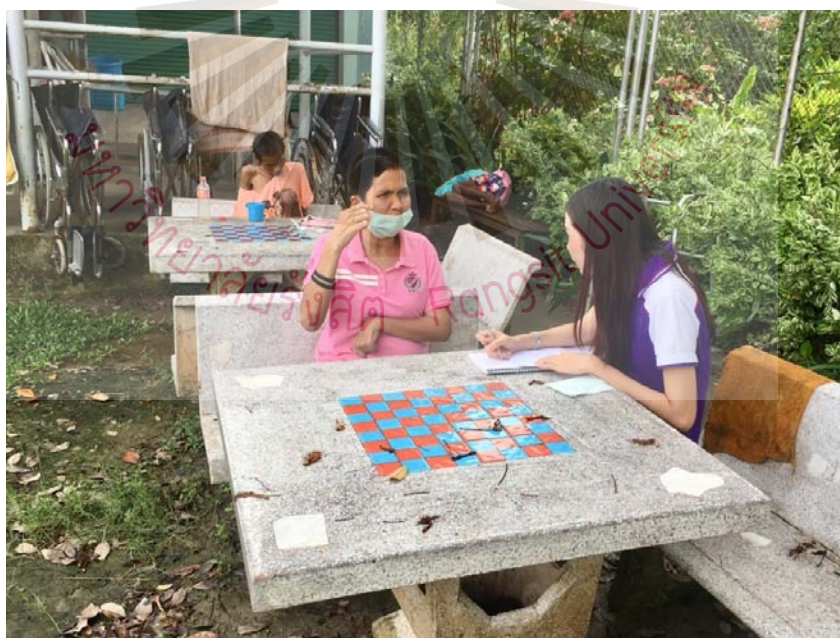
รูปที่ ภาคผนวก ง.2 ภาพขณะสัมภาษณ์ผู้ให้ข้อมูลสำคัญ 23 พฤษภาคม 2561