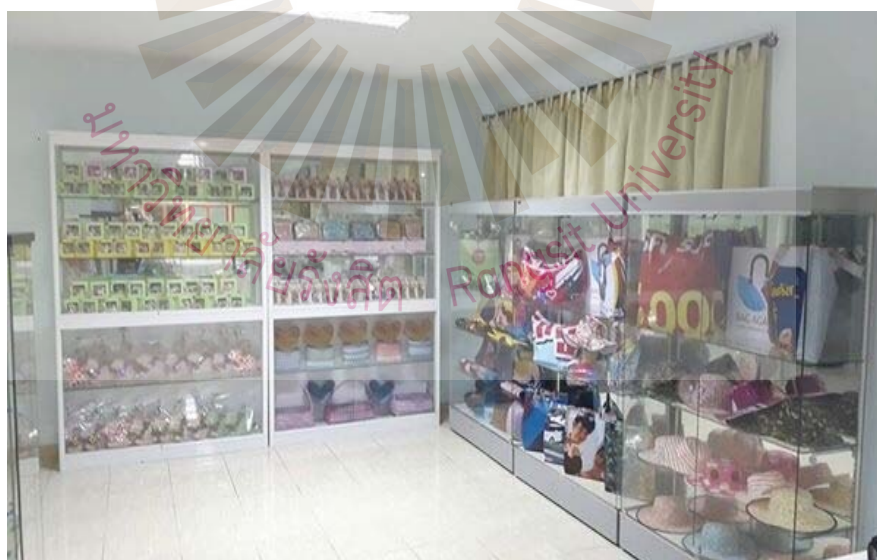
รูปที่ ภาคผนวก ง.16 ห้องหัตถกรรม งานฝีมือ ตามโครงการชัยบุรีโมเดล 25 พฤษภาคม 2561