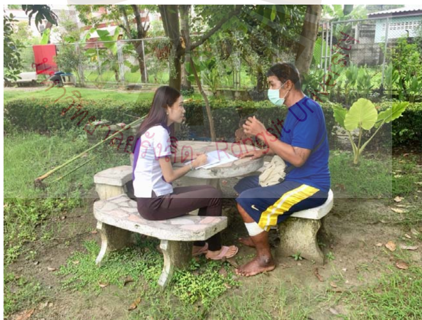
รูปที่ ภาคผนวก ง.6 ภาพขณะสัมภาษณ์ผู้ให้ข้อมูลสำคัญ 23 พฤษภาคม 2561