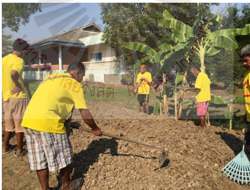
รูปที่ ภาคผนวก ง.12 ภาพกิจกรรมการเกษตร ตามโครงการธัญบุรีโมเดล 24 พฤษภาคม 2561