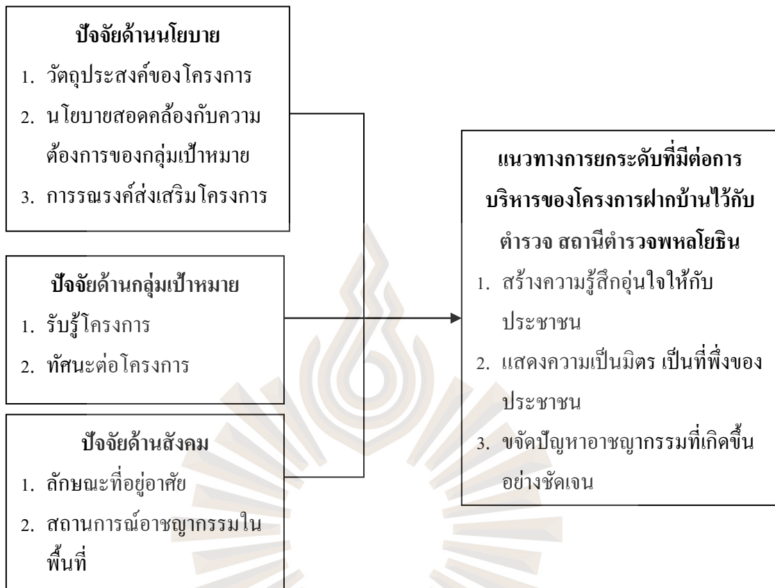
รูปที่ 2.1 กรอบแนวคิดในการวิจัย