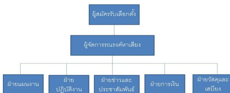
รูปที่ 2.2 รูปแบบของการจัดองค์กรในการรณรงค์หาเสียงเลือกตั้งอย่างเป็นทางการหรือเป็นระบบ

1.2) การจัดองค์กรในการรณรงค์หาเสียงเลือกตั้งอย่างเป็นทางการหรือเป็นระบบ เป็นการปรับปรุงระบบและให้ความสำคัญเกี่ยวกับองค์กรมากขึ้นมีการแบ่งงาน แบ่งหน้าที่ความรับผิดชอบ มีโครงสร้างหน้าที่แตกต่างกันตามภารกิจที่ปฏิบัติ มีเป้าหมายงานของแต่ละหน่วยงานชัดเจนยิ่งขึ้น แต่ ก็มีปัญหาในการโต้แย้งการปฏิบัติงานเป็นระบบทางการมากเกินไป รูปแบบของการจัดองค์กรในการรณรงค์หาเสียงเลือกตั้งมีรูปแบบดังต่อไปนี้