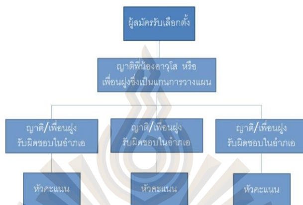
รูปที่ 2.1 รูปแบบของการจัดองค์กรอย่างไม่เป็นทางการในการรณรงค์หาเสียงเลือกตั้ง

อาศัยความสัมพันธ์ส่วนตัวระหว่างผู้สมัคร กับญาติมิตร เพื่อนฝูง โดยไม่มีการจัดแบ่งหน้าที่ของบุคลากรอย่างชัดเจน เป็นระบบ เป้าหมายจะเป็นกลุ่มญาติพี่น้อง เพื่อนฝูงรู้จักเป็นอันดับแรก คะแนนเสียงที่ผู้รับสมัครหวังจะได้เป็นกอบเป็นกำ คือ คะแนนเสียงของผู้ที่อยู่ในชนบทที่มีฐานะทางเศรษฐกิจและการศึกษาที่ไม่สูงนัก โดยการจัดตั้งจากระบบหัวคะแนน โดยมีรูปแบบของการจัดองค์กรในการรณรงค์หาเสียงเลือกตั้ง ดังนี้