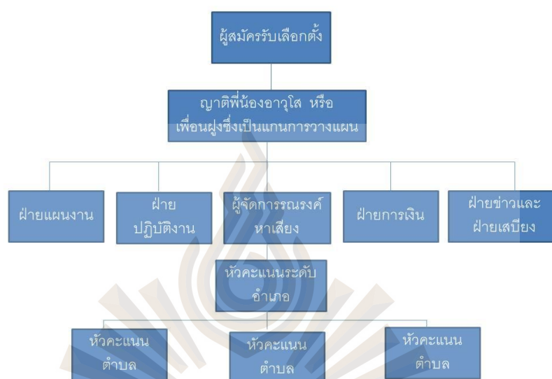
รูปที่ 2.3 รูปแบบการผสมผสานระหว่างการจัดองค์กรในการรณรงค์หาเสียงเลือกตั้งอย่างไม่เป็นทางการ กับการจัด องค์กรในการรณรงค์หาเสียงเลือกตั้งอย่างเป็นทางการหรือเป็นระบบ

อย่างไรก็ตาม รูปแบบของการจัดองค์กรในการรณรงค์หาเสียงเลือกตั้ง ในทุกรูปแบบที่กล่าวมาข้างต้นจะมีทั้งข้อดีและข้อเสียควบคู่กัน ไป ดังนั้นในการจัดองค์กรรณรงค์หาเสียงเลือกตั้งที่ดี และมีความคล่องตัวในการปฏิบัติงาน เหมาะสมกับทุกสภาพพื้นที่ ควรมีการใช้ทั้ง 2 ระบบในองค์กรเดียวกัน ดังนี้