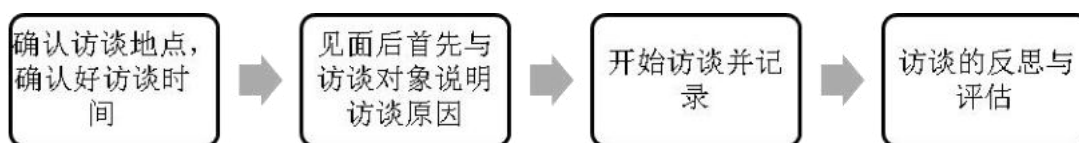
图 3.1 访谈的顺序